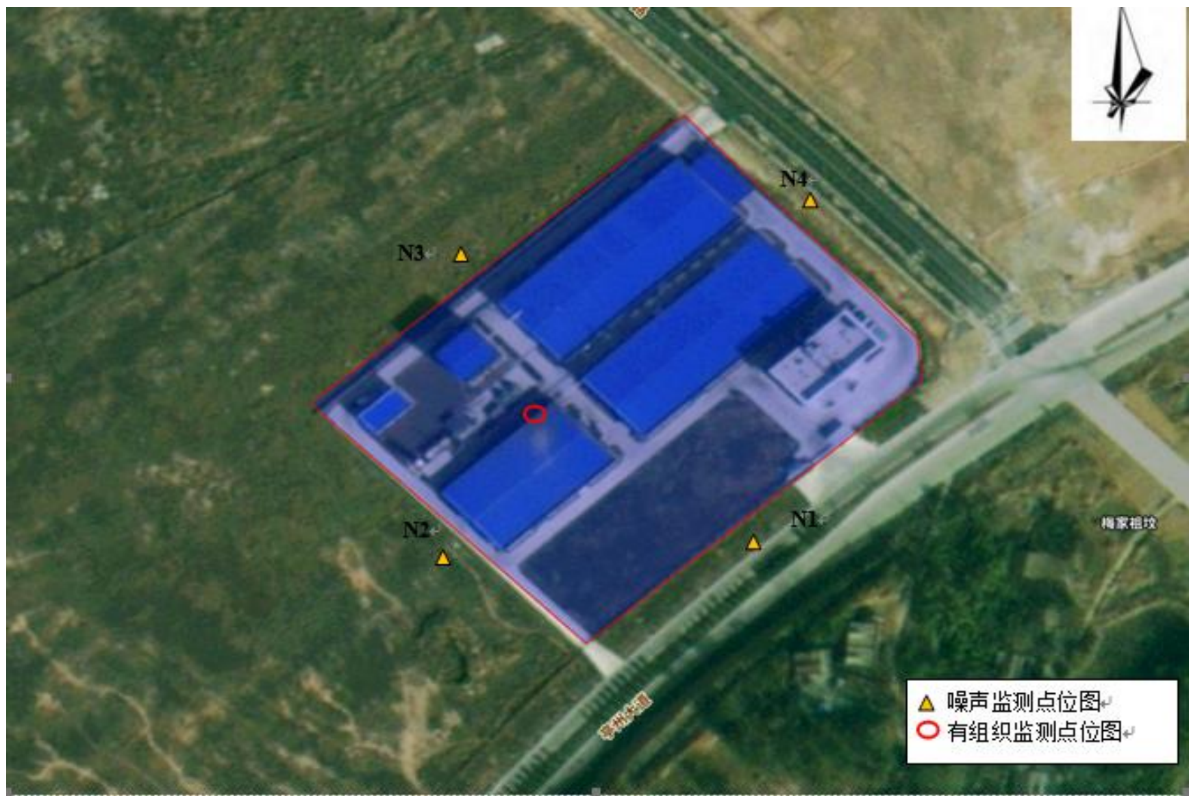
附图 5 监测点位图