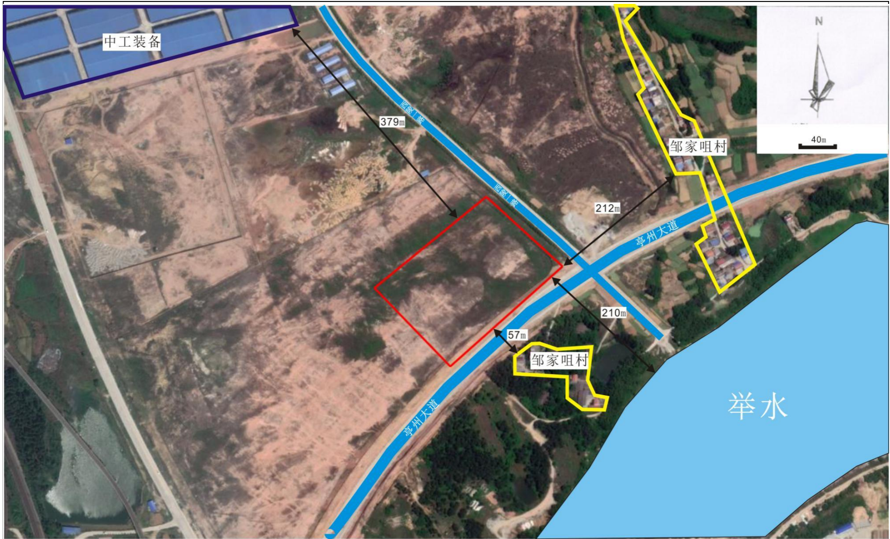
附图 2 项目周边关系示意图