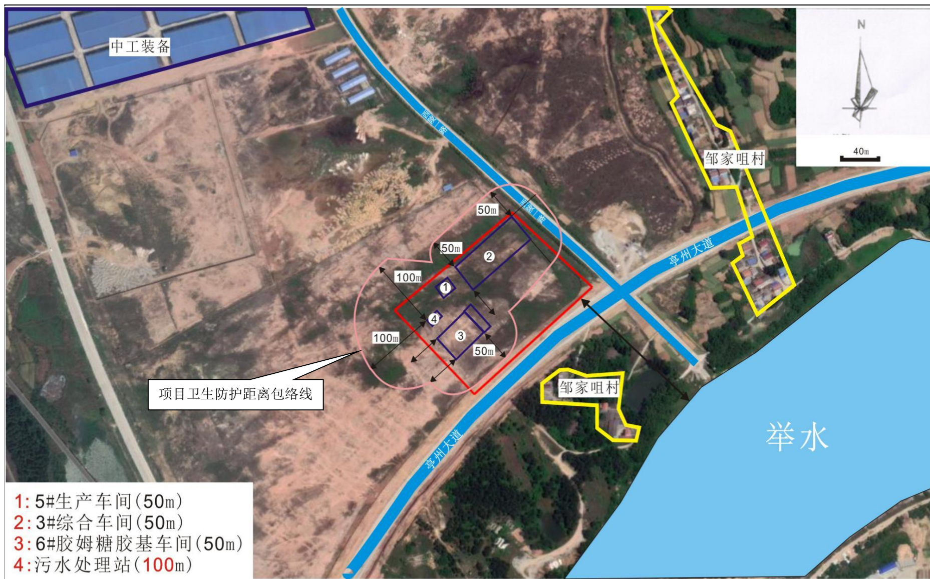
附图 4 全厂卫生防护距离包络线图